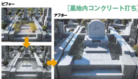
コンクリートの上に敷く玉砂利はお好きな色を選べます。