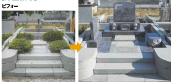
コンクリートを打った上に御影石を張ります。御影石はお好きな色を選べます。