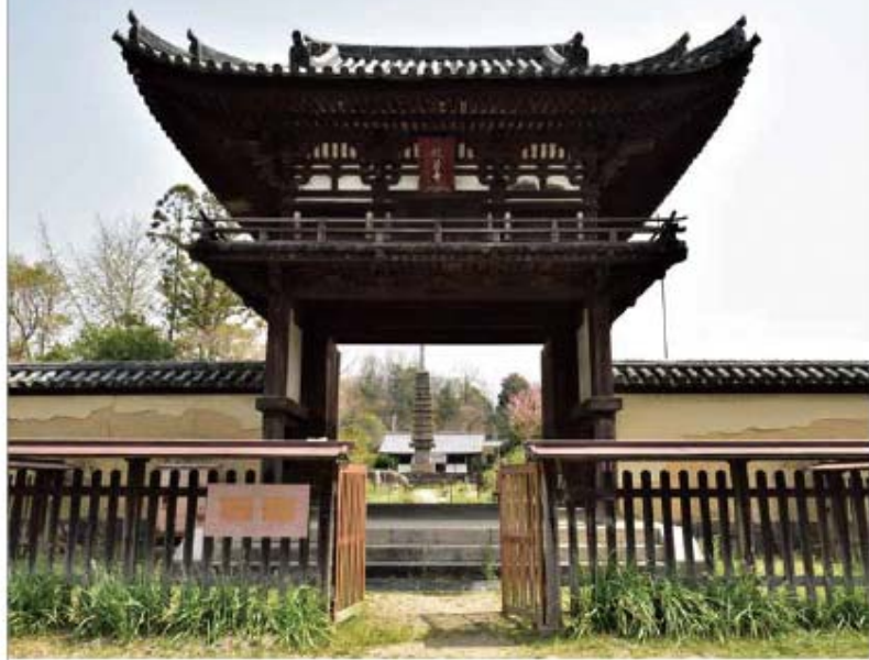
境内西側を通る京街道に面して立つ国宝の楼門。鎌倉時代に造られたもので楼門遺構では日本最古の作例になる。和棟に天竺様式を取り入れ、美しく軽快な屋根の反りが特徴。

般若経の学問寺として栄え、国宝の楼門をはじめ、数々の文化財を今に伝える般若寺。奈良を代表する名刹であり、また、境内の石仏を彩って咲く春の山吹、秋のコスモスが美しい花の寺としても人々の心を和ませています。