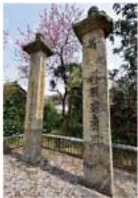
笠塔婆形式の石塔では日本最古の作例とされる重要文化財の笠塔婆。刻まれた梵字は鎌倉時代独特の「薬研(やげん)彫り」の代表例。