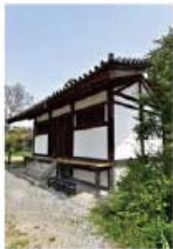
境内の東側にある経蔵は、お経の全集である一切経(大蔵経)を収蔵する施設として利用されてきた鎌倉時代築の建構。重要文化財