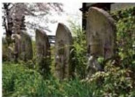
本堂を取り囲むように並ぶ石仏は、西国三十三所観音霊場のそれぞれの御本尊が石像となったもの。慈悲深い優しいお顔の観音様に癒される。