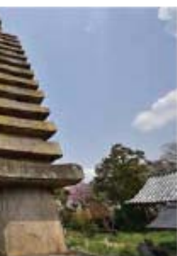
境内の中心に立つ総高14.2mもある日本最大の十三重石塔。宋から招かれた石大工の伊行末(いぎょうまつ)の傑作として知られ、長い歴史と格の高さを今に伝える。重要文化財

奈良市の北部、京街道沿いにある般若寺。飛鳥時代に創建された由緒ある古刹ながら、境内に一步入れば、お堂を取り囲むように表情豊かな石仏が静かに並び、まるで山寺のような長閑で親しみやすい雰囲気にも包まれています。また、四季を通じて様々な花が見られる花の名所でもあり、特に秋のコスモスの美しさから「コスモス寺」とも呼ばれています。